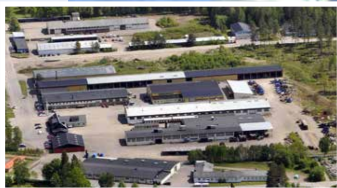
Huvudkontor och produktion i Rottne

I Stensele som ligger i Västerbottens län tillverkar vi våra olika engreppsaggregat, större kranar, karosserier och hyttstommar till alla maskinmodeller.